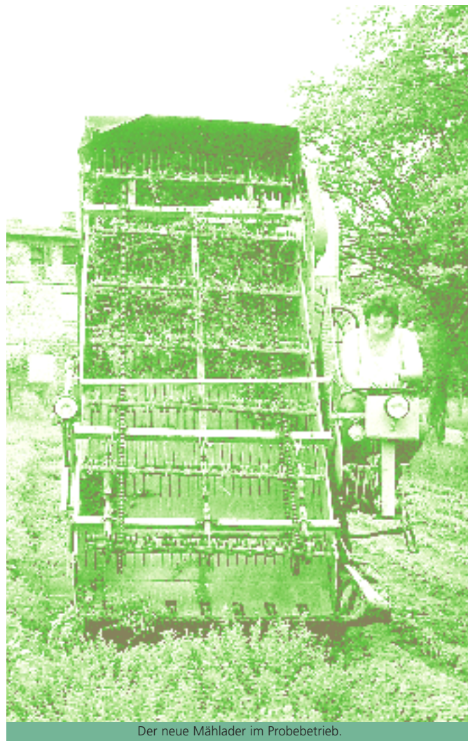
Der neue Mähader im Probetrieb.

Aus einem Schrank im Lagerraum holt sie zwei Marmeladengläschen. „Diese Fruchtaufstriche sind unsere zweite Produktstrecke. Wir haben sechs verschiedene Fruchtaufstriche und zwei Chutneys, also auch etwas Herzhaftes. Dabei verarbeiten wir in erster Linie Mirabellen, die hier sehr